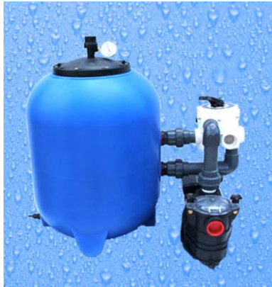
ABB. BASIC SM 500 / S